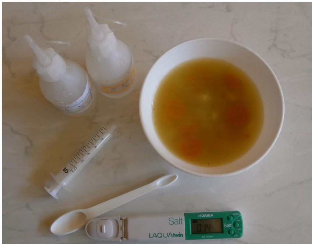
Orientační stanovení koncentrace soli v polévce